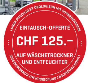
«SMART-DRY» Deal Eine Aktion von ProKilowatt und Lunor.

Die ausschliesslich in der Schweiz hergestellten Geräte trocknen und pflegen alles, was einem wichtig ist. Mit ihrer intelligenten Steuerung regeln sie das Klima-Management, sorgen für einen optimalen Trocknungsgrad und schützen damit gleichzeitig auch langfristig die Bausubstanz des Hauses. —