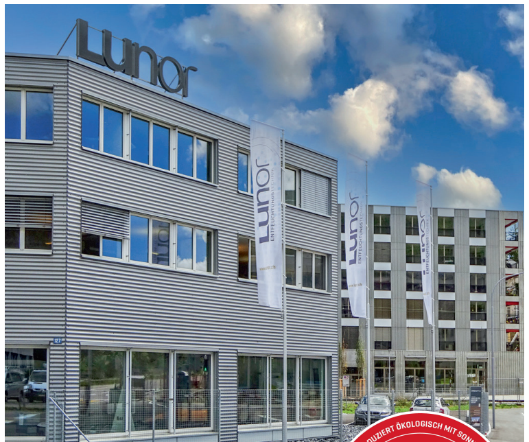
Produktionsstandort Zürich seit 1947.

der kleinen Fabrik-Spenglerei ist ein modernes, nachhaltiges Unternehmen mit internationaler Ausstrahlung entstanden, das intelligente Entfeuchtungssysteme und innovative, nachhaltige Raumluft-Wäschetrockner für Ein- und Mehrfamilienhäuser entwickelt und produziert.