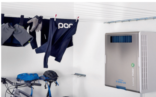
Trocknet alles, was man liebt – die Raumluft-Wäschetrockner von Lunor.

Durch die langjährige Erfahrung mit Belüftungstechnik und der Erkenntnis, dass feuchte Luft an kalten Oberflächen kondensiert, entwickelte Lunor schon sehr bald danach die ersten Entfeuchtungssysteme. Und lange bevor Nachhaltigkeit in der Schweiz ein Thema war, brachte das Familienunternehmen energiesparende, langlebige Raumluft-Wäschetrockner auf den Markt. Die Stromeinsparung mit der Wärmepumpentechnik war dermassen markant, dass bereits 1984 Energieeinsparungen von 50% gegenüber Tumblern möglich waren. Seitdem ist viel passiert. Heute, 75 Jahre und viele Innovationen später, steht Lunor noch immer in Zürich. Und aus